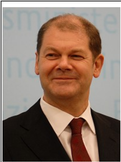
Olaf Scholz

Ein Beitrag vom Arbeits- und Sozialminister Olaf Scholz